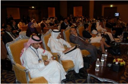
جانب من الحضور يستمعون الي تلاوة توصيات الورشة من جانب المشاء كند

المبادرة العربية لبناء القدرات الوطنية لمكافحة الإتجار بالأشخاص ، وكذلك استعراض الاستراتيجية العربية لمكافحة الإتجار بالأشخاص التي ستعمل تحت رعاية ومظلة جامعة الدول العربية والتي من المؤمل الاعلان عنها قريباً. كما هدف اللقاء الى تقديم المقاربة القائمة على حقوق الإنسان في مجال مكافحة الإتجار بالأشخاص من خلال استعراض وتقديم المبادئ التوجيهية التي أصدرتها المفوضية السامية لحقوق الإنسان حول مكافحة الإتجار بالأشخاص.