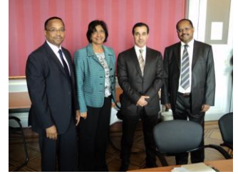
المفوضة السامية نافيه بيلاي وأعضاء من الوفد القطري

المتحدة السامية لحقوق الإنسان ودولة قطر سوف يعزز من قدرة مركز الأمم المتحدة وتطوير مقومات الشراكة بين مفوضية الأمم المتحدة السامية ودولة قطر. وأشار الشيخ خالد بن قطر ودول أخرى في الإقليم يتطلعون ويعتمدون كثيراً على مفوضية الأمم المتحدة السامية لحقوق الإنسان لتعزيز وبناء القدرات في مجال تعزيز سيادة القانون ودعم عمليات التحول الحالي التي تشهدها المنطقة.