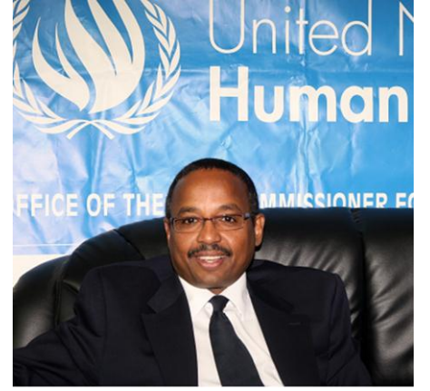
دكتور العبيد العبيد، مدير مركز الأمم المتحدة للتدريب والتوثيق في مجال حقوق الإنسان لجنوب غرب اسيا والمنطقة العربية

دكتور العبيد العبيد مدير مركز الأمم المتحدة