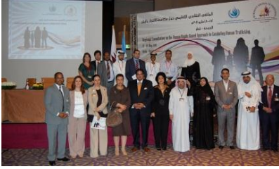
جانب من المشاركين في جلسات التشاور الإقليمي